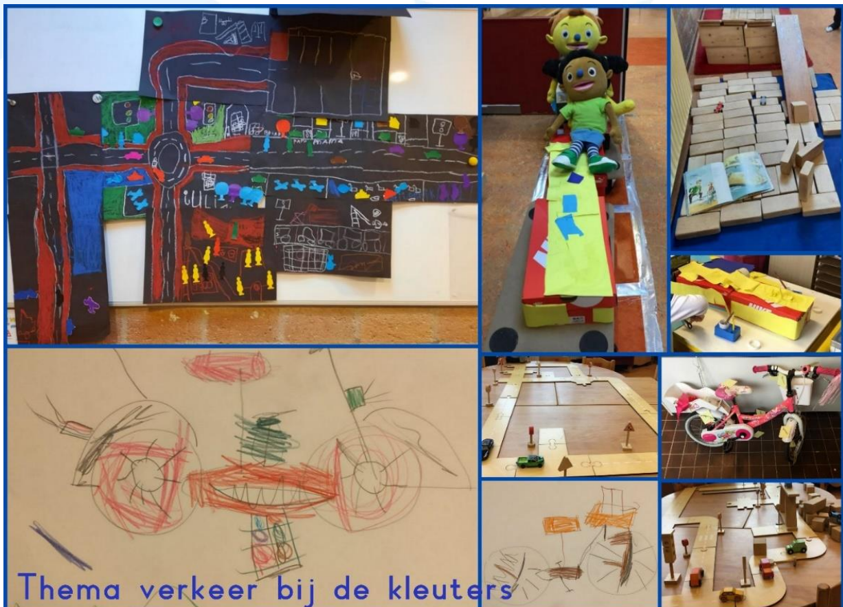
Thema verkeer bij de kleuters

aan het verkeer, enz. Buiten speelden de kinderen met diverse attributen verkeerssituaties na. Er werd een weg getekend en natuurlijk een zebepad. Een "agent" regelde het verkeer met een echt spiegelei. Toen de weg en het zebepad opeens door de regen verdwenen waren, tekenden enthousiaste kinderen deze zelf opnieuw. In de hal bij Zichthof 11 reden Pompom en Loeloe mee op de trein die kinderen van de Tureluur hadden gemaakt. Zij hadden daarvoor goed naar een foto van een echte trein gekeken. De kinderen van de Meerkoet tekenden hun eigen weg met een kruispunt of een rotonde. In de bouwhoek speelden sommige kinderen het verhaal van Tim op de tegels na. De kinderen van de Zwaan bekeken een fiets van één van de kinderen en benoemden alle onderdelen. En, heel knap, zij tekenden zelf een fiets! De kinderen van de Kwikstaart legden als samenwerkingstaakje een zo lang mogelijke verkeersweg en maakten er daarna zelf een foto van met de iPad. De kinderen van de Fuut hebben op het schoolplein van Zichthof 10 een verkeersweg gemaakt van stoepkrijt met bijpassend zebepad, getekende kinderen en auto's. In de klas is er d.m.v. een spel met de peuters geoefend om de kleine verkeersregels onder de knie te krijgen. De komende weken gaan we nog veel meer leren, spelen en knutselen over dit leuke onderwerp.